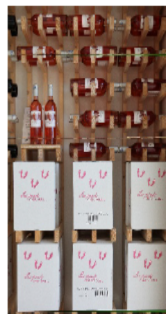
Des cartons personnalisés