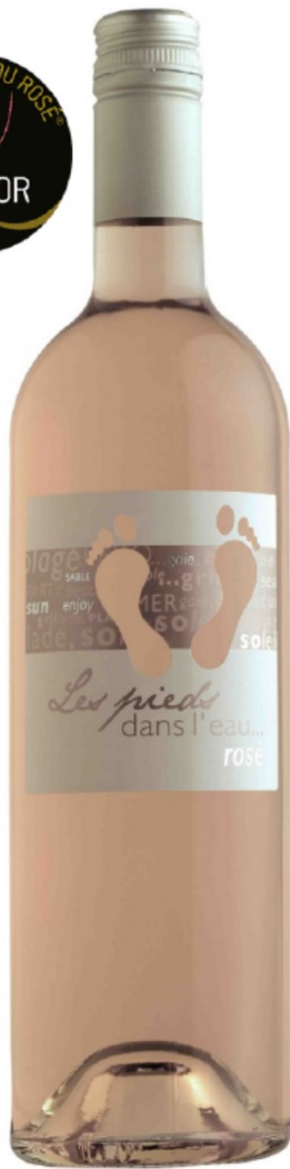
IGP Pays d'oc

Ni trop pâle, ni trop soutenu, c'est un rosé tourmaline, compromis par toutes les nations. Les pieds dans l'eau, on ressent, on vit, on trinque, on rit !!!